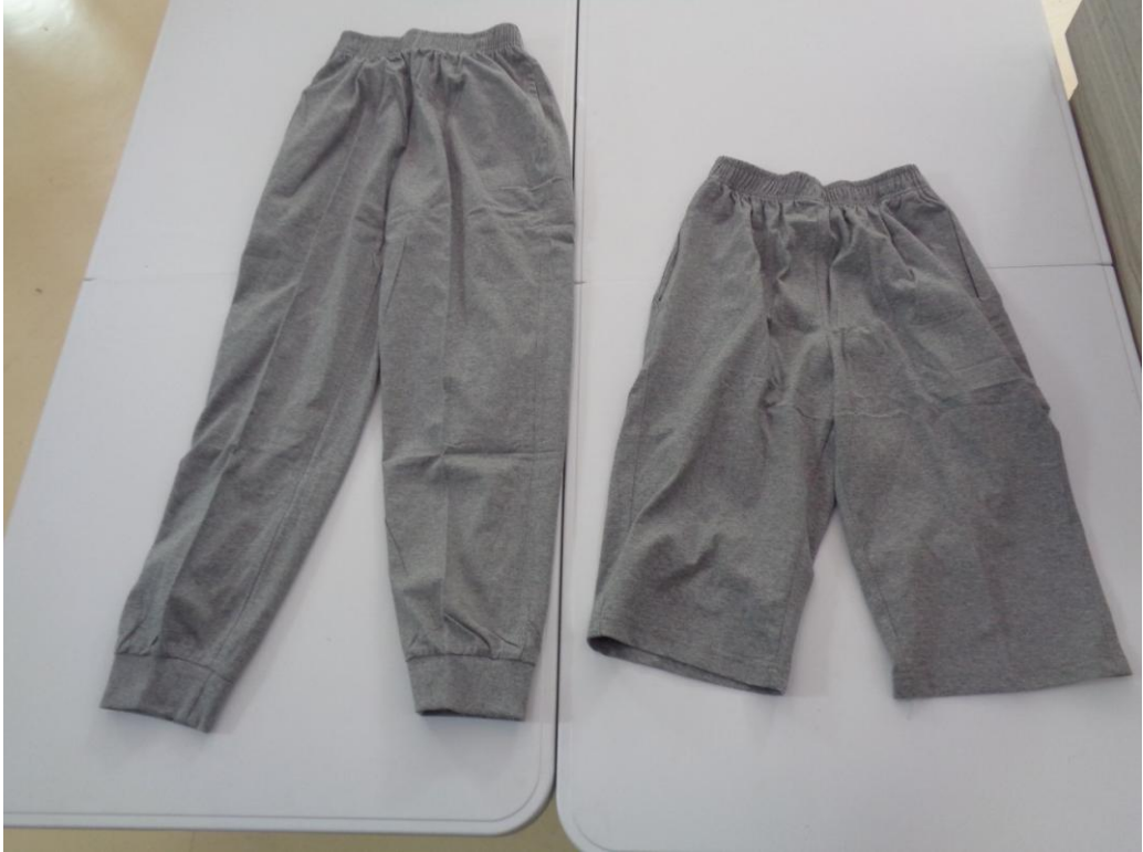
灰色长裤；灰色中裤