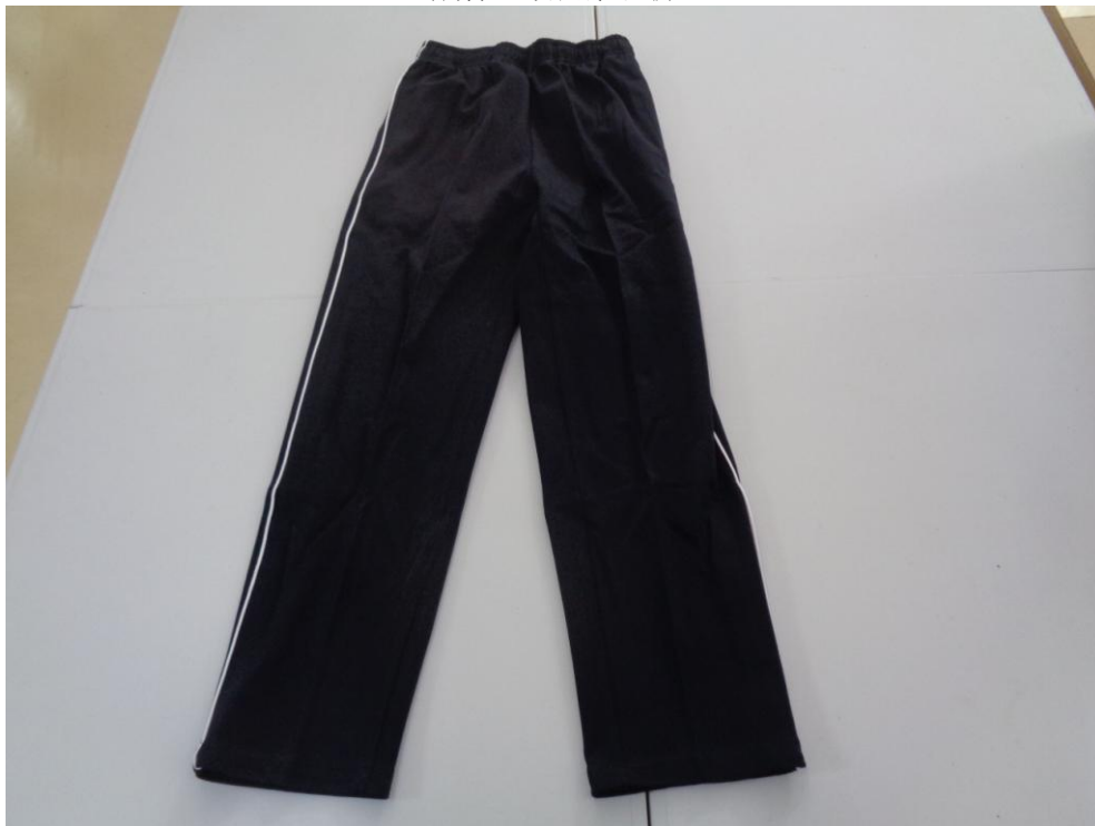
藏青色嵌白条长裤