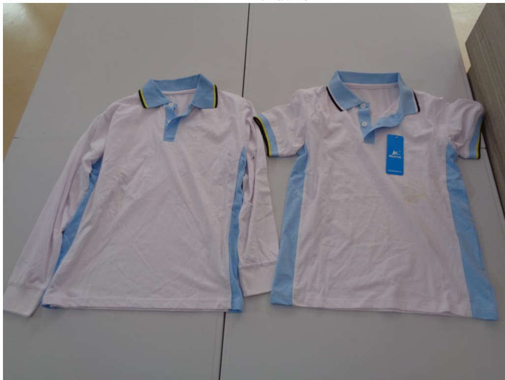
白/蓝色长/短袖 T 恤