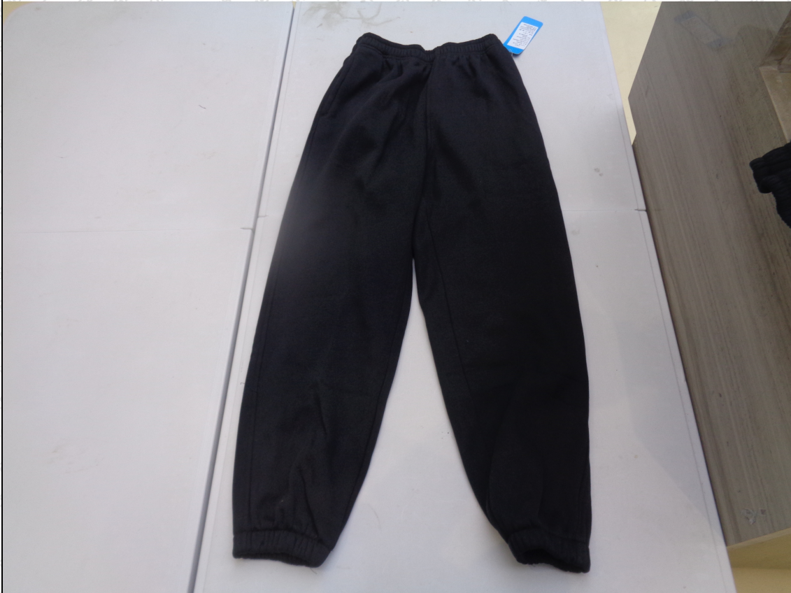
藏青色长裤（收裤脚款）